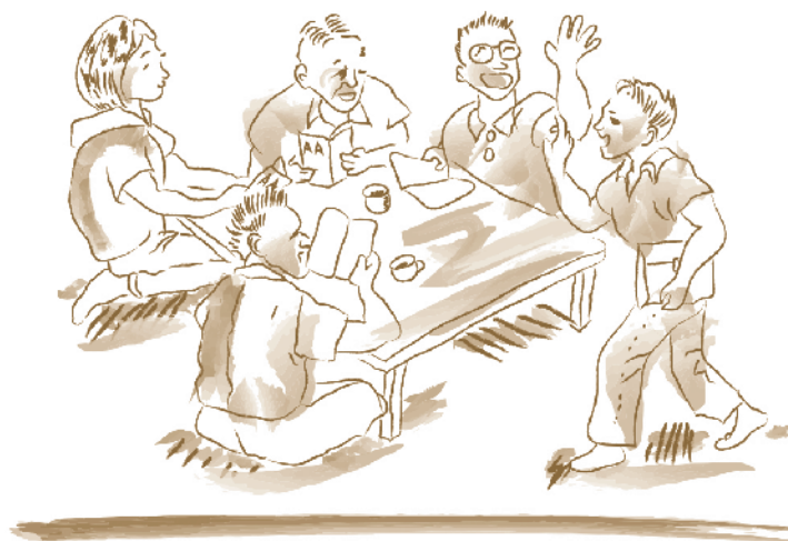
Fig. 3: Una reunión en Japón