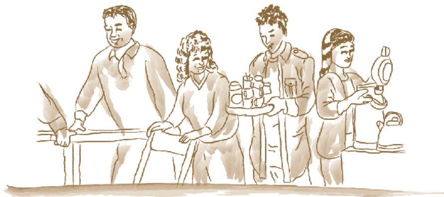
Fig. 2: Una reunión en México

del corazón (abarcando los Tres Legados), y 224 veces en Alcohólicos Anónimos llega a su mayoría de edad . La palabra «sobriedad» aparece en números mucho más modestos en esos mismos textos. ¿Cuál es entonces el núcleo del mensaje?