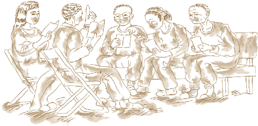
Fig. 4: Una reunión en EE. UU.

«1.ª Tradición. Nuestro bienestar común debe tener la preferencia; el restablecimiento personal depende de la unidad de A.A. El alcohólico que de verdad desea conservar su sobriedad se da cuenta, al aceptar los dos primeros pasos, de que necesita practicar diariamente los principios espirituales (esencia del programa) para ser heredero del Legado de Recuperación . Al hacerlo, ve con claridad que lo obtenido es un don y que, como tal, no se lo debe a sí mismo [...]» 15