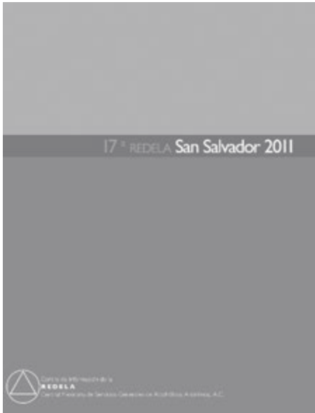
Reporte de la 17.ª REDELA, San Salvador 2011

En primer término, debemos recordar que AA «es algo más que un conjunto de principios; es una sociedad de alcohólicos en acción en el mundo».