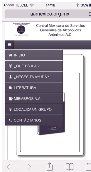
Menú de la página de inicio del nuevo sitio, vista en un dispositivo móvil.

De esta manera, tu Oficina de Servicios Generales ofrece un instrumento actualizado de difusión y de apoyo para transmitir nuestro mensaje. Te invitamos a aprovecharlo y a ser tú mismo conducto motivador de la información y servicios que se realizan en AA.