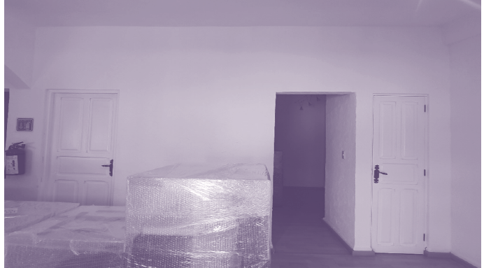
Museo Nacional «Nuestras Raíces»