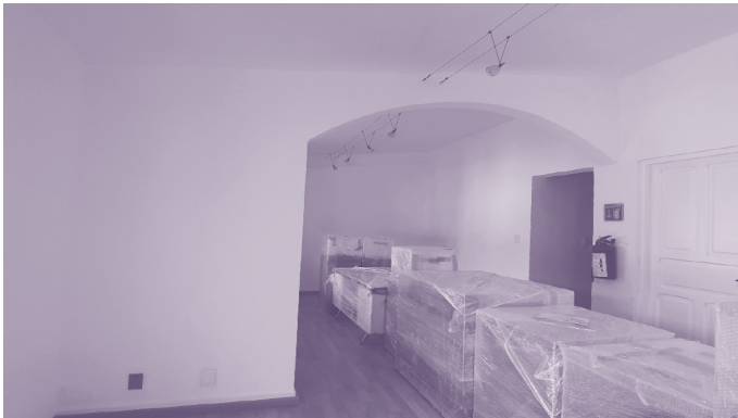
Museo Nacional «Nuestras Raíces»