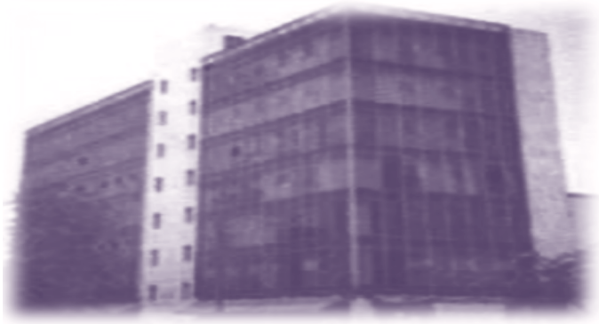
Primera sede en Gabriel Leyva núm. 26 – 3. er Piso, hoy Eje Central Lázaro Cárdenas, en el Centro de la capital mexicana. Inicia el 9 de diciembre de 1969.