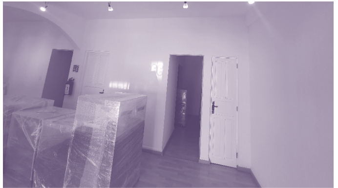
Museo Nacional «Nuestras Raíces»