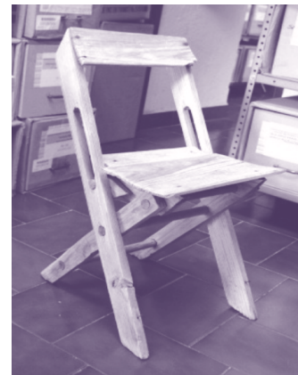
En los comienzos de la Oficina de Servicios Generales el mobiliario disponible era únicamente esta silla de tijera y un escritorio donado por un miembro de AA. Como anécdota se dice «que todos deseaban sentarse en ella» porque era la única silla.