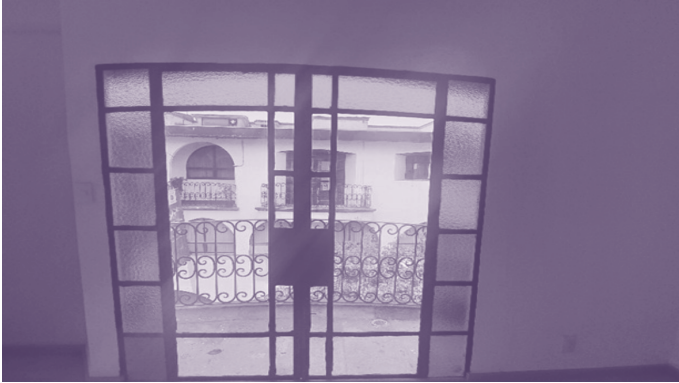
Museo Nacional «Nuestras Raíces»