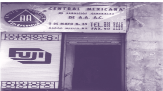
Segunda sede en Av. 5 de Mayo núm. 39 altos en el Centro Histórico de la Ciudad de México. Inicia el 18 de mayo de 1981.